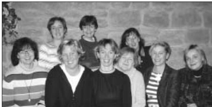
Das Team von Wer? Was? Wo? Wann? für Ellerstadt